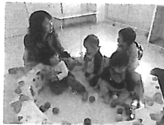
手作りサークルで楽しむ0歳児