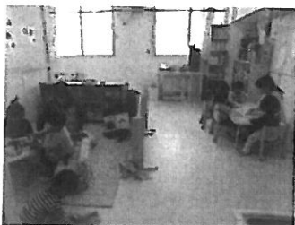
それぞれのあそびに夢中になっている1歳児