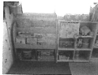
2歳児クラスの自由あそびコーナー