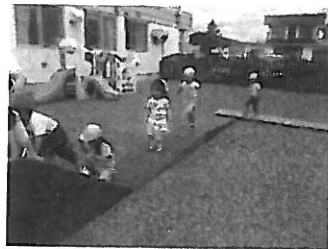
手作りサーキットであそぶ2歳児