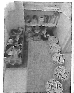
0歳児クラスのくつろぎコーナー