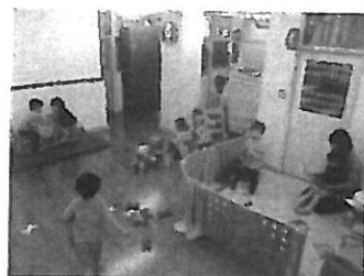
友だち同士であそぶ2歳児